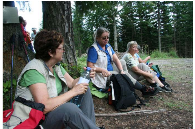
Rast in der Trauch