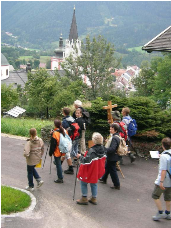
Einzug in Mariazell Kreuzweg