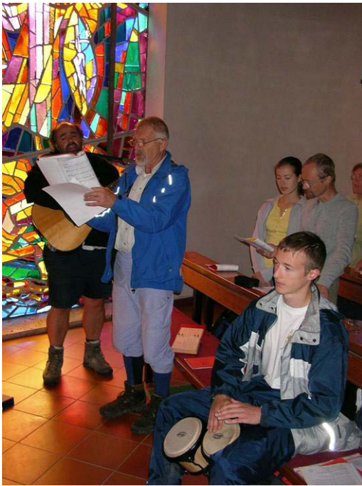
Bruder Klaus Kapelle